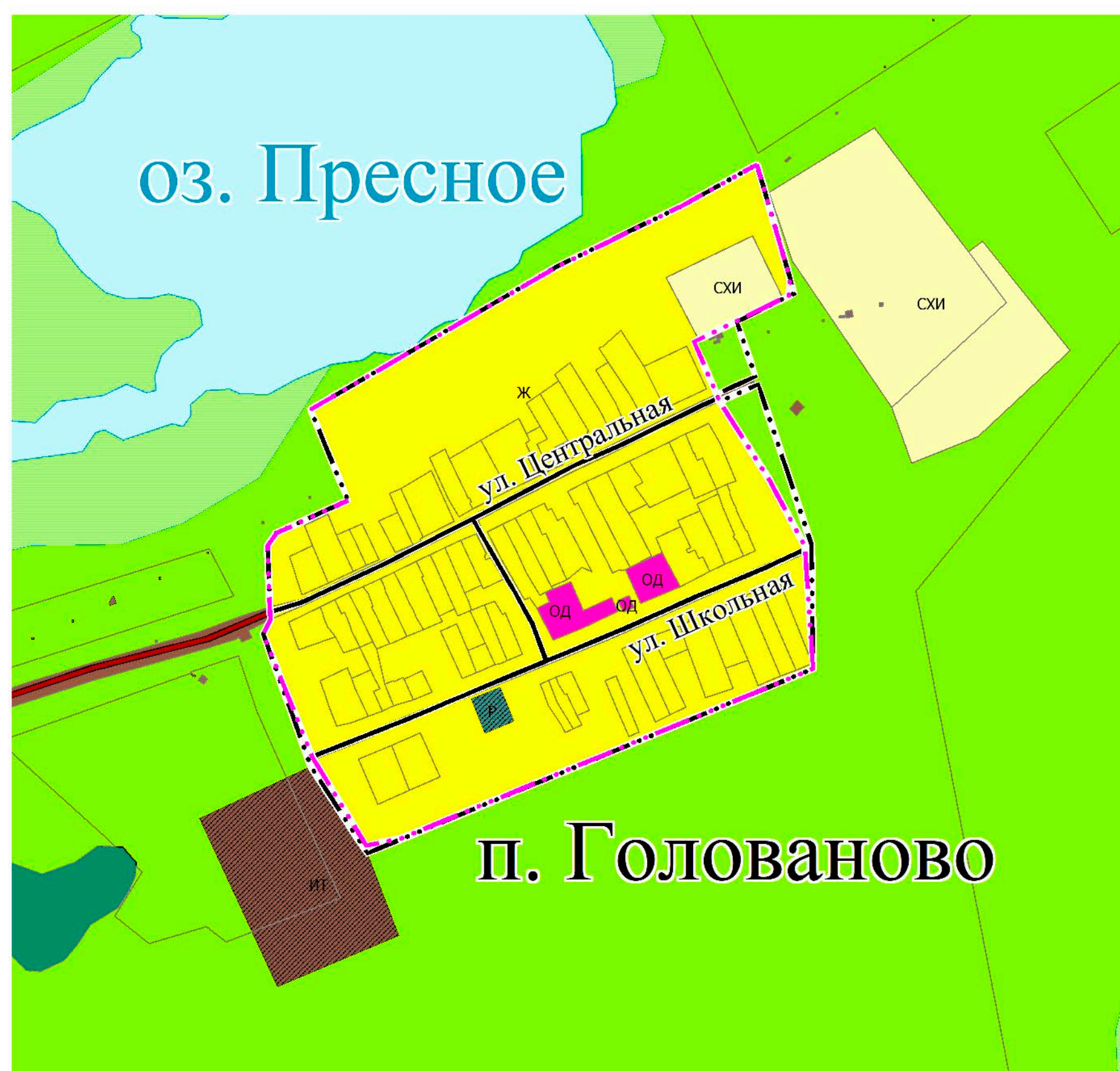
ФРАГМЕНТ КАРТЫ ГРАДОСТРОИТЕЛЬНОГО ЗОНИРОВАНИЯ П.ГОЛОВАНОВО, М 1:5 000